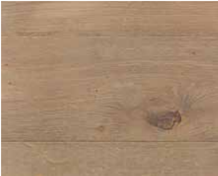
SMOKED OAK 1971