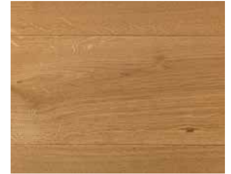
LIGHT OAK 8991