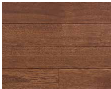
ENGLISH BROWN 7371