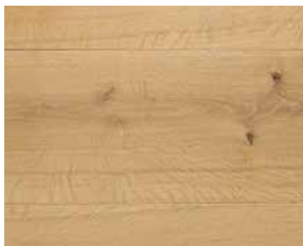
LIGHT FUME 8083