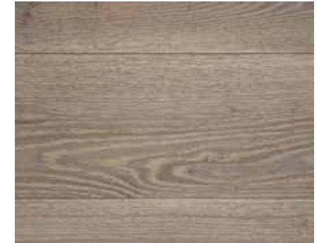
AQUAVINTAGE 2C COTTAGE 7590 HWO ECRU 5781 HWO TITAN MATT