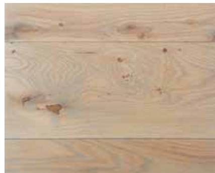
OLD GREY 5496