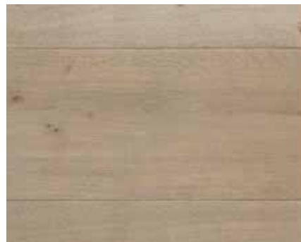
ASH GREY 7944