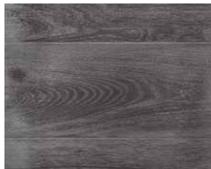
HARDWAXOIL METALLIC 5574 Wstępnie zabarwione Aquastain BLACK