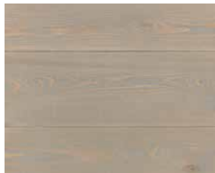
LIGHT GREY 6206