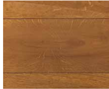
MID OAK 8990