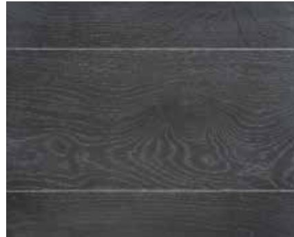
RS BLACK 5396 HWO METALLIC 5574 HWO TITAN MATT