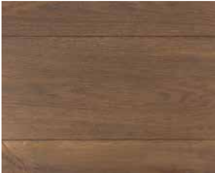
DOUBLE SMOKED OAK 1918