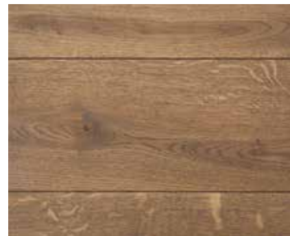
SMOKED OAK 2377