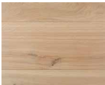
LIGHT GREY 5782