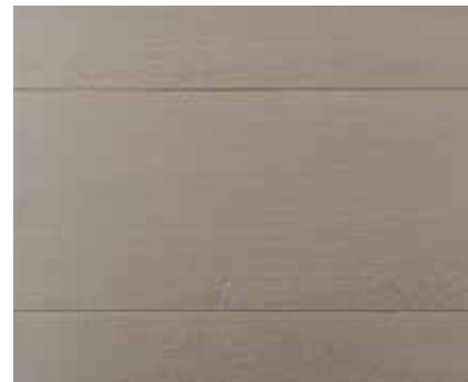
STORM GREY 8994