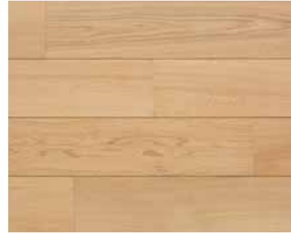
NATURAL WHITE 7250