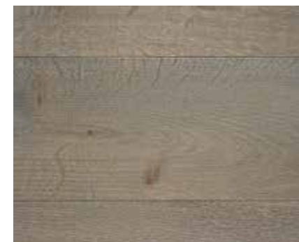
ANTHRACITE GREY 5490