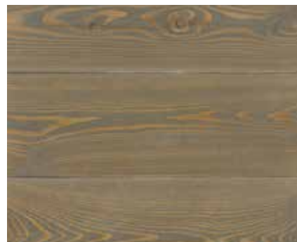
RUSTIC GREY 6358