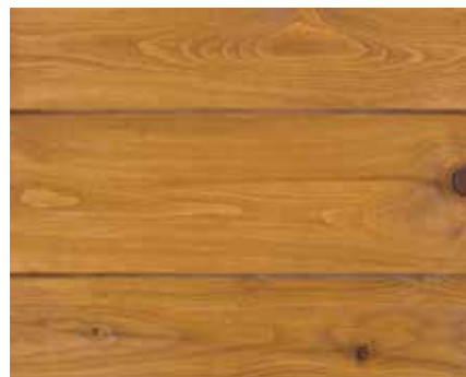
LIGHT OAK 7726