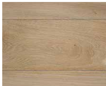
LIGHT GREY 2061