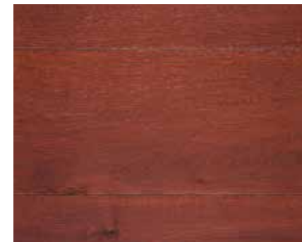
ENGLISH RED 5060