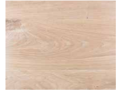
EXTRA WHITE 5676