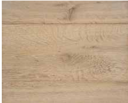
VINTAGE BARO 2317 HWO MAGIC EXTRA WHITE 8265 HWO TITAN MATT