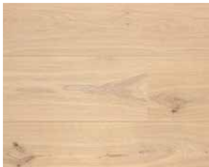
OLD WHITE 8537