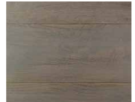
MID GREY 8995