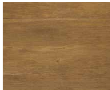
DARK FUME 8106