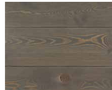
OLD GREY 6207