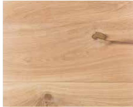
NATURAL WHITE 5485