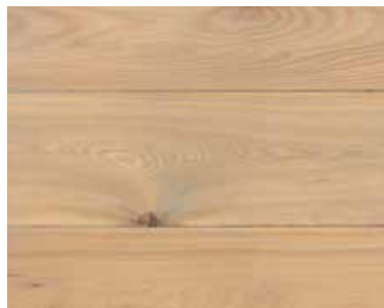
LIGHT GREY 7728