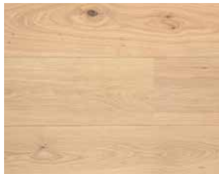
NATURAL WHITE 8513