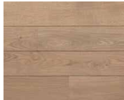
OLD GREY 7257