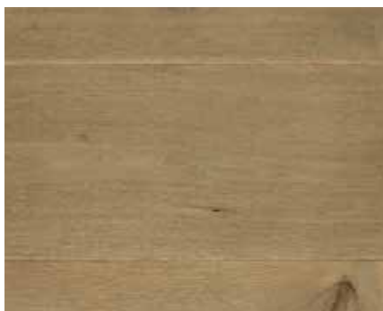
COPPER FUME 8127