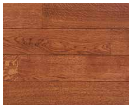
CHERRY RED 7370