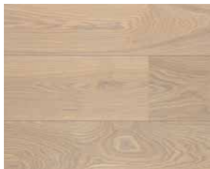
OLD GREY 8225