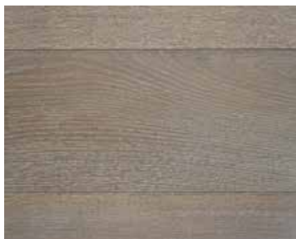
OLD OAK 1836