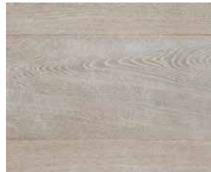
VINTAGE F BLEACHING 5066 sputkać wodą LIMING PASTE 5393 FLOORING WAX CLEAR 1571