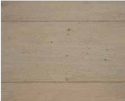
RUSTIC GREY 1972