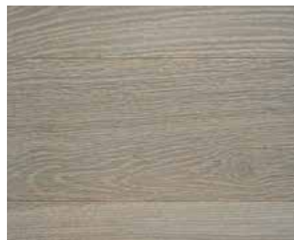
WEATHERED OAK 2265