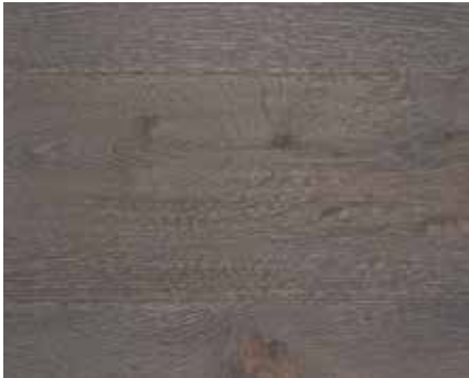
BURNED OAK 5517