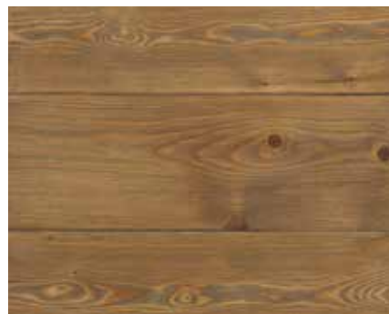
DARK GREY 7729