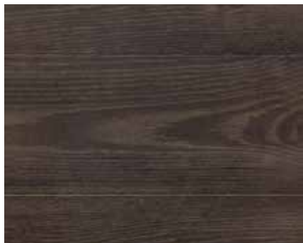
HARDWAXOIL EFFECT BRONZE 7643 Wstępnie zabarwione Aquastain BLACK