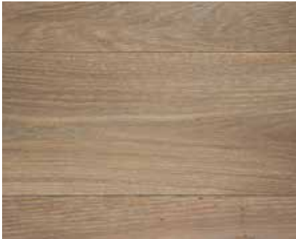
STRIPPED OAK 2243