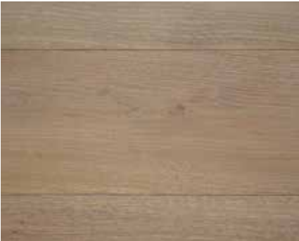
OLD GREY 2353