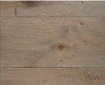
CASTLE OAK 2338