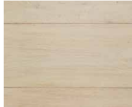
VINTAGE BARO 2317 RS WHITE 2426 szlifowanie 2 WARSTWY HWO TITAN MATT