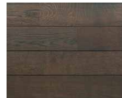
BLACK INK 7261