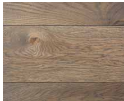
DARK GREY 5667