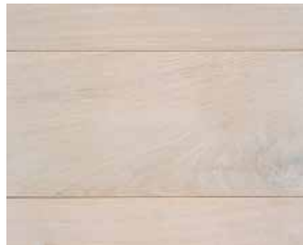
RS WHITE 2426 HWO MAGIC WHITE 8637 HWO MAGIC WHITE 8637