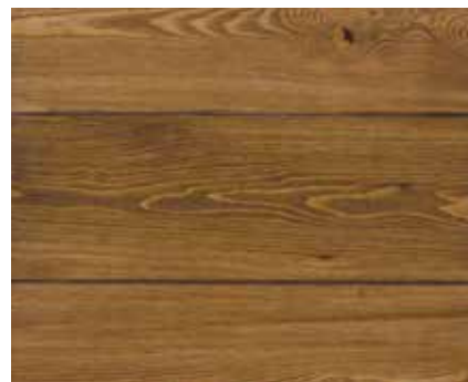
DARK OAK 7636