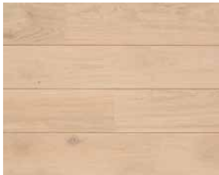
EXTRA WHITE 7252