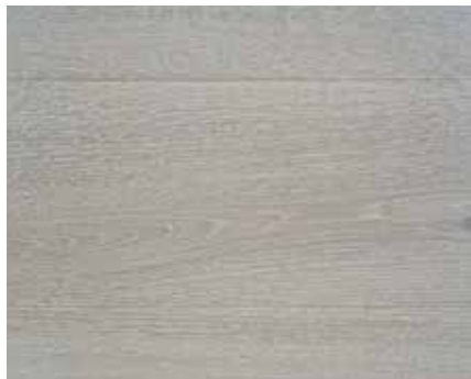
RS WEATHERED OAK 2265 HWO MAGIC WHITE 8637 HWO MAGIC WHITE 8637