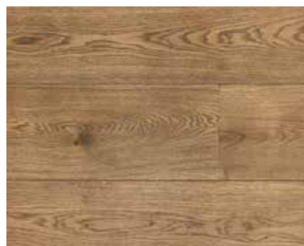
SMOKED OAK 8643