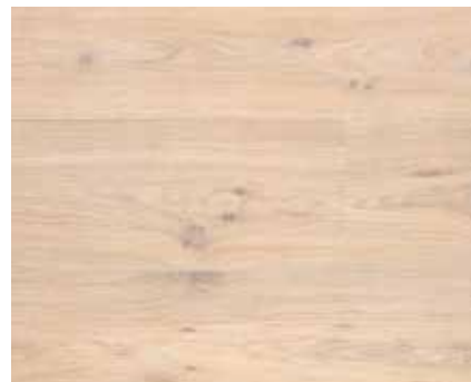
EXTRA WHITE 8265