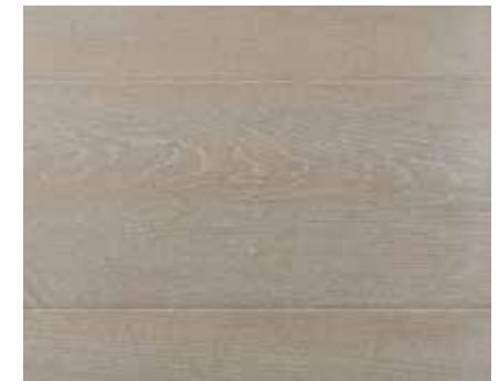
RS RUSTIC GREY 1972 HWO MAGIC WHITE 8637 HWO TITAN MATT